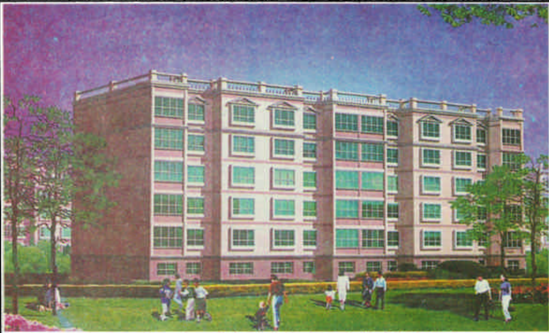
东营市一品园房地产开发有限责任公司向新老朋友问好、致意

别忘了:打长途电话在区号前加17951,长途话费可节省60%。 免费咨询电话:1860