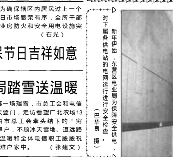
新年伊始，东营区电业局为保护安全供电，对下属各供电站的电网运行进行安全检查。

市总工会 电信局踏雪送温暖 本报讯 元月十日，踏着新世纪第一场瑞雪，市总工会和电信局领导，带着过年礼物和救助金，再次登门，走访慰问广北农场13户困难家庭，他们是市电信局去年由总工会牵头结下的“穷亲”。一行人走村串户，不顾冰天雪地、道远路滑，把寄托着党的温暖和全体电信职工殷殷祝福的救助金送到困难户家中。 （张建文）