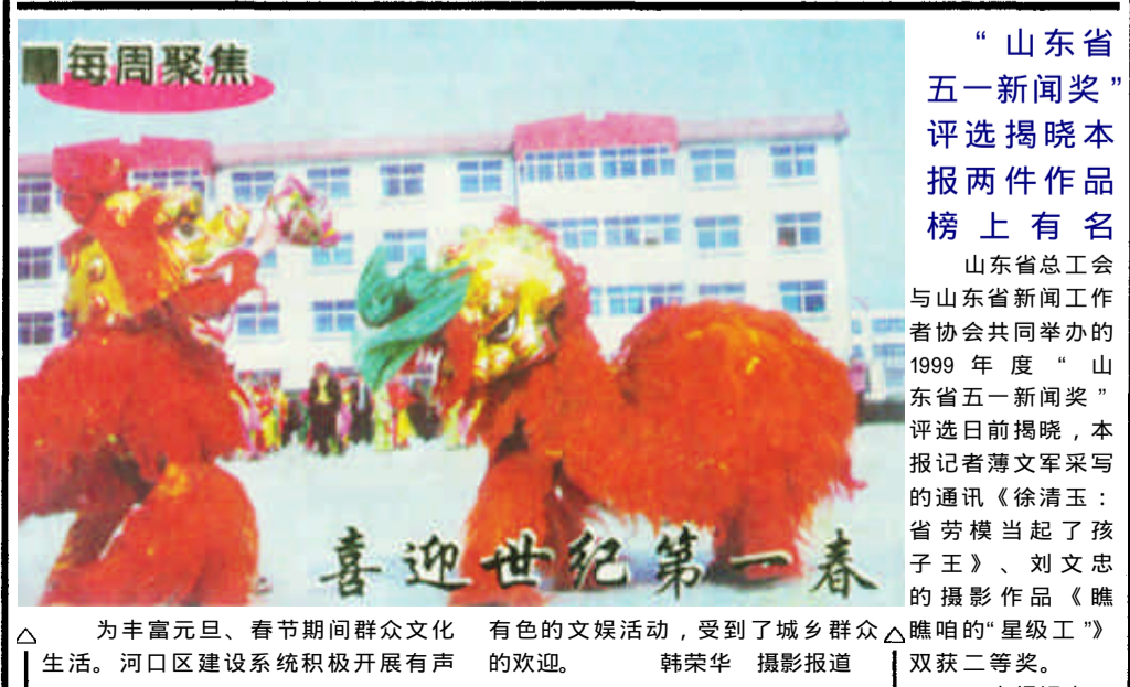
为丰富元旦、春节期间群众文化生活的。河口区建设系统积极开展有声有色的文娱活动，受到了城乡群众的欢迎。

原因之二，科普展览的形式得到了人们的喜爱和认可。科普展览是以形象展示为主，集图片、实物展示和模型、仪器表演及文字说明、口头讲解、声像放映等为一体，通过多种宣传形式的综合运用和有机配合，形象生动地展示一系列科技内容的一种群众喜闻乐见的宣传形式，被称为宣传普及科学技术的“重型武器”。这次科普展览是由中国科协、省科协组织有关学会和专家学者进行创作的，集全园同类展览之精华，电脑喷绘、制作精美，规模空前，自然就吸引了众多观众。可见，随着市民的科普观念和意识的逐步增强，符合市民科技需要、适应时代形式的内容丰富、直观的科普展览将越来越受到市民的青睐。