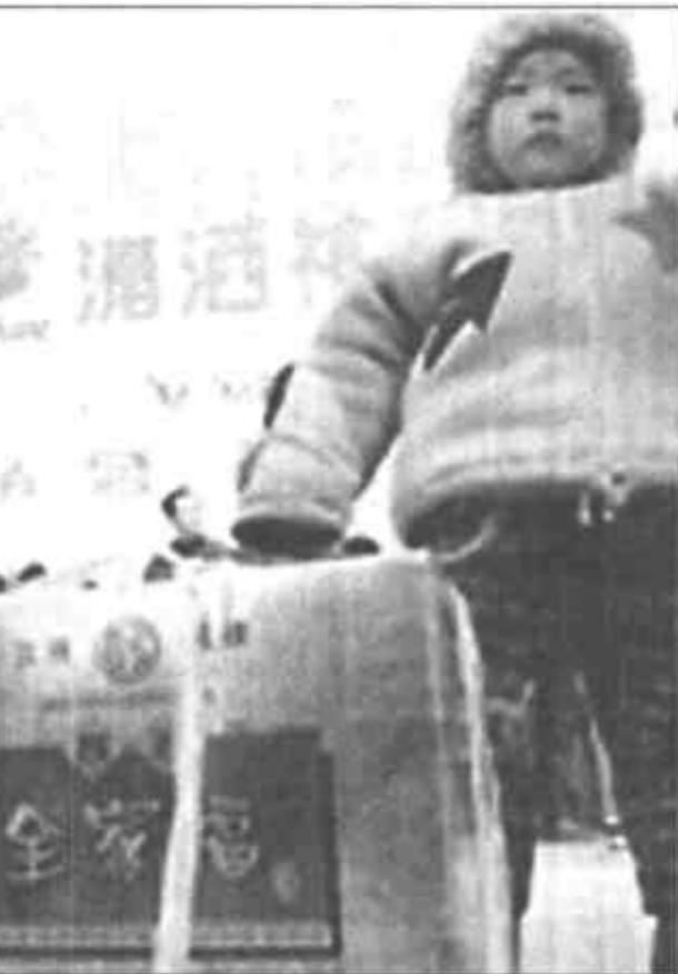
1月13日,郑州举办2001年春节食品展销会,以保证广大市民能够以优惠的价格买到货真价实的食品。图为一位孩子在看管大人刚买的年货。

中国民航总局运输司有关人士说,民航730万春运客流量是根据民航本身能提供的航班运力和去年客流上涨情况计算出来的。